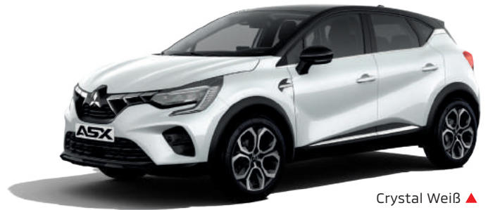
Crystal Weiß ▲ mit optionalem Dach in Onyx Schwarz