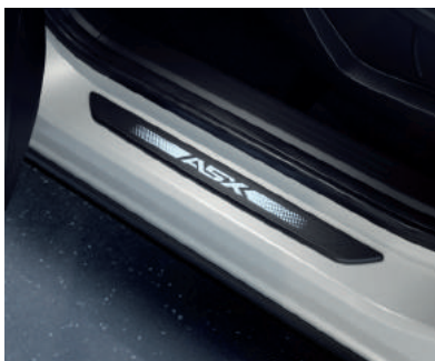
▲ Einstiegsleisten In verschiedenen Ausführungen, z.B. mit Beleuchtung, erhältlich.