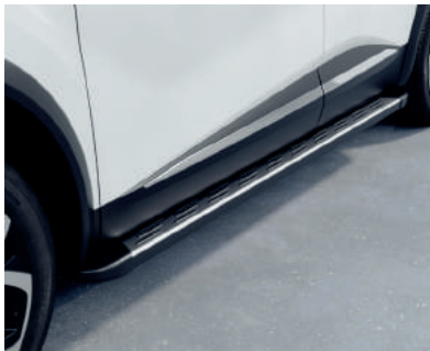
▲ Trittbretter Stylisch und funktional.