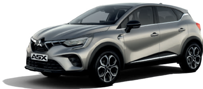
▲ Steel Grau