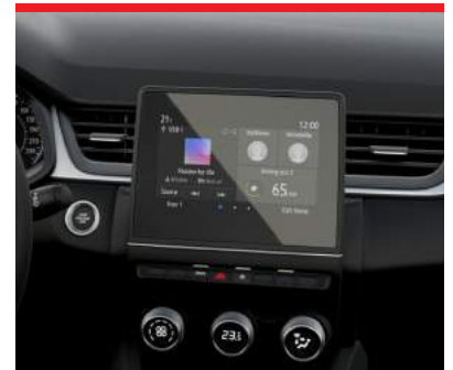
7" Smartphone-Link Display Audio inkl. Smartphone-Integration und DAB+ Radio Inform, Invite