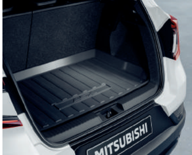
▲ Laderaumwanne Mit erhöhtem Rand.