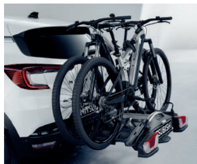
▲ Heckfahrradträger Für bis zu 3 Fahrräder.