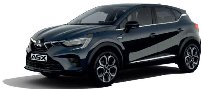
▲ Charcoal Blau

Oder entscheiden Sie sich wahlweise (ab Intense) für eine dynamische Zweifarblackierung mit Dach in Onyx Schwarz – für einen gelungenen Auftritt.