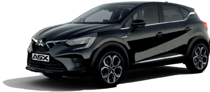
▲ Onyx Schwarz