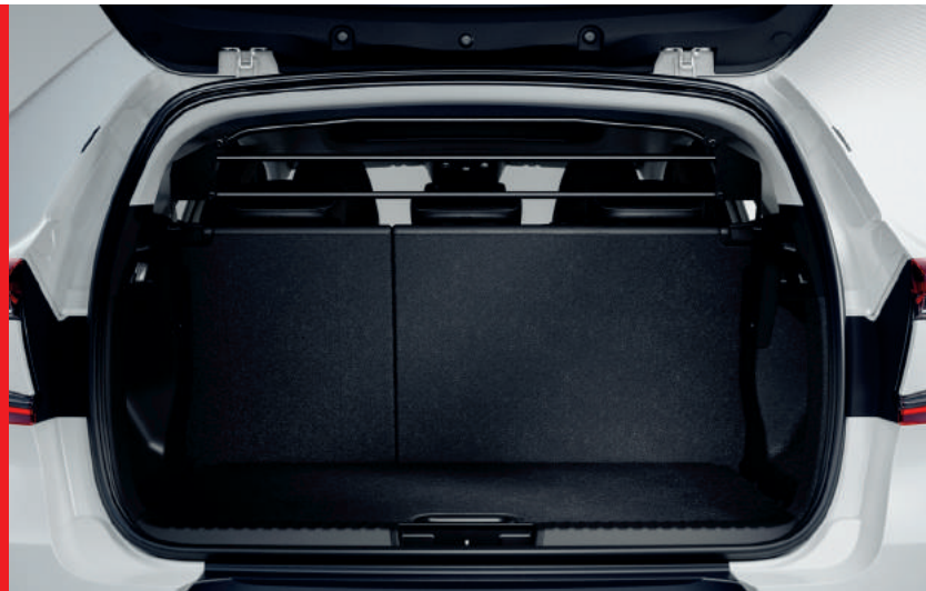
◀ Trenngitter Schwarz beschichtet.