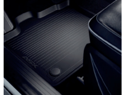
▲ Gummimatten-Satz Mit Befestigungspunkt.