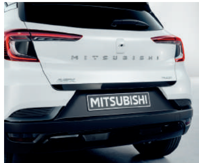
▲ Heckklappenzierleiste Schwarzes oder silbernes Design.