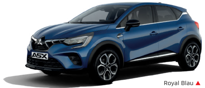
Royal Blau ▲