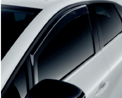
▲ Seitenwindabweiser Für die vorderen Seitenfenster.