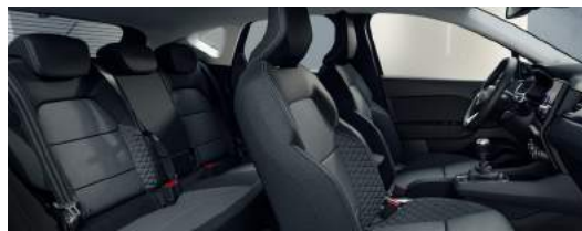
INFORM & INVITE Stoffsitze grau/schwarz