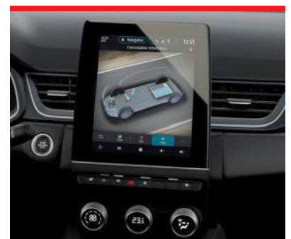
9,3" Smartphone-Link Display Audio inkl. Navigation Intense, Diamond