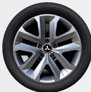
17" Flex Wheel Stahlfelge mit Spezial-Zierkappe Inform, Invite

Egal ob 17" Flex Wheel oder 18" Leichtmetallfelgen: Der neue ASX macht immer eine gute Figur.