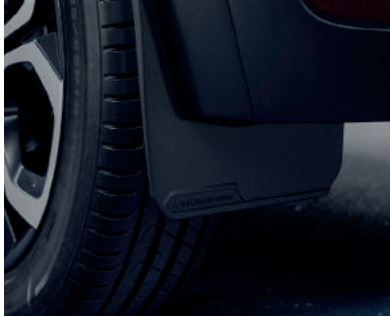
▲ Schmutzfänger Für vorne oder hinten.