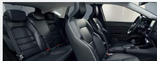
DIAMOND Ledersitze schwarz