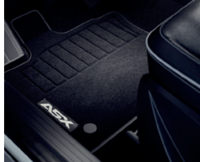
▲ Textilmatten-Satz Comfort oder Elegance.