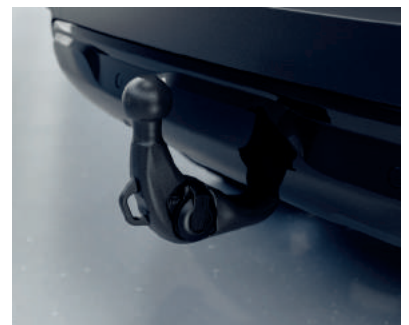
▲ Anhängervorrichtung In den Ausführungen starr, abnehmbar und schwenkbar erhältlich.