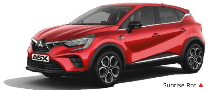
Sunrise Rot ▲