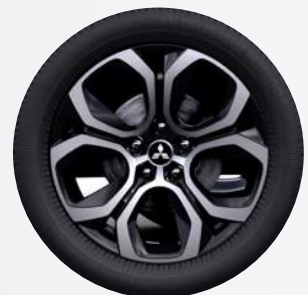
18" Leichtmetallfelgen Diamanten-cut in silber/schwarz Intense, Diamond