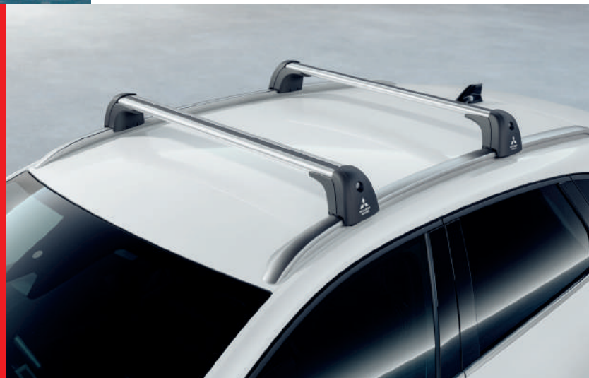
◀ Grundträger Wingbar Type.