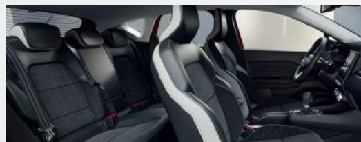
INTENSE Stoffsitze dunkelgrau mit Ledernachbildung hellgrau/schwarz