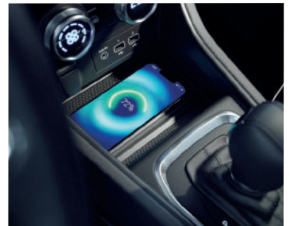
▲ Induktionsladematte Induktionsladung für Smartphones.