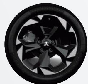
18" Leichtmetallfelgen ▲ Diamanten-cut in silber/schwarz Intense, Diamond