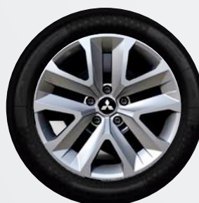
17" Flex Wheel ▲ Stahlfelge mit Spezial-Zierkappe Inform, Invite

mit Dach in Onyx Schwarz ab Ausstattung INTENSE € 500,-