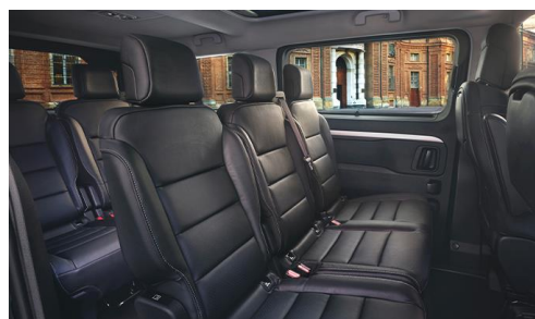
Standard Sitzreihen in 2-3-3 Anordnung