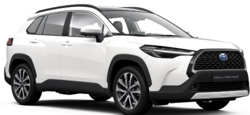
040 Pure White