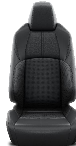
Sitzbezug Leder 2) schwarz (LB20)