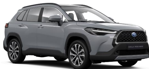
1H5 Manhattan Grey Metallic