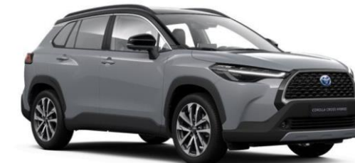
2YY Manhattan Grey / Attitude Black