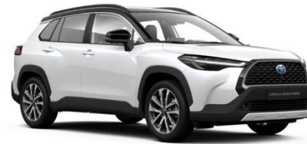
2PS Platinum Pearlwhite / Attitude Black