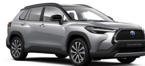
M12 Shimmering Silver Metallic/ Attitude Black