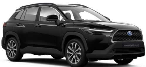
218 Attitude Black Metallic