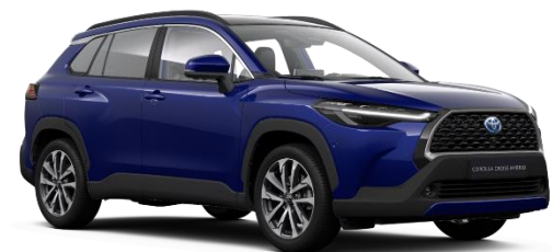
8W7 Cobalt Blue Metallic