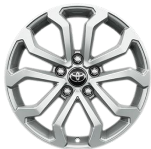
17" Leichtmetallfelge 5 Doppelspeichen silber