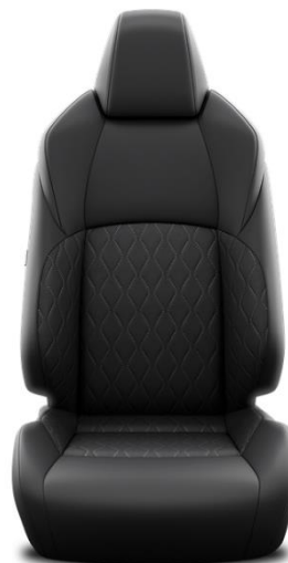
Sitzbezug Stoff schwarz (FA20)