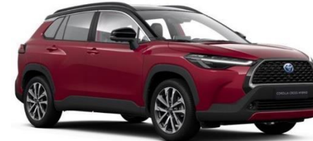
2YD Tokyo Red / Attitude Black

Erfahrungsgemäß können Druckfarben den Farbton von Lackierungen nicht originalgetreu wiedergeben.