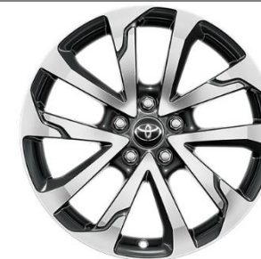
18" Leichtmetallfelge 5 Doppelspeichen anthrazit/oberflächenpoliert