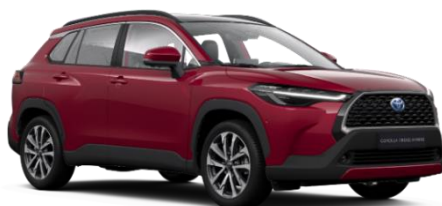
3T3 Tokyo Red Metallic