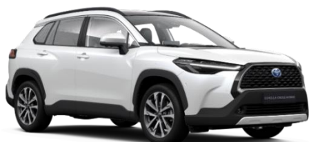
089 Platinum Pearlwhite Metallic