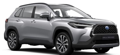
1L0 Shimmering Silver Metallic