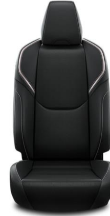
Sitzbezug Ledernachbildung, schwarz