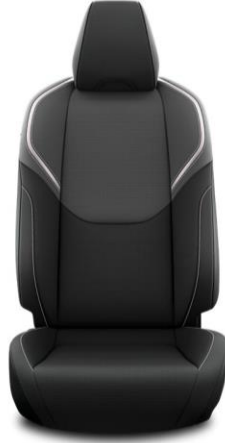
Sitzbezug Stoff, schwarz