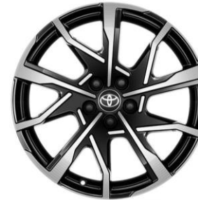
19" Leichtmetallfelgen in Schwarz, poliert (195/50R19)