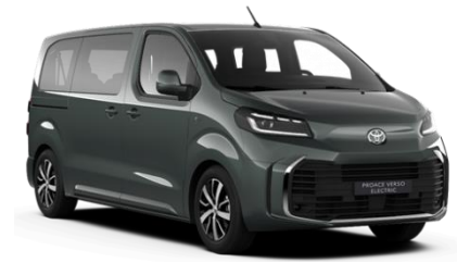
EDU All Terrain Green

● = Serie. Die Preise sind unverbindliche Preisempfehlungen des Herstellers ab Werk in Euro exkl. MwSt.