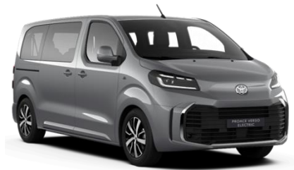
KCA Silver Shadow