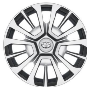
17" Stahlfelgen mit Radzierkappen