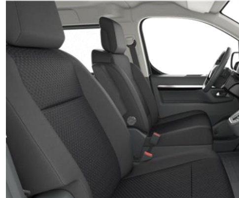
Sitzbezug Stoff Family