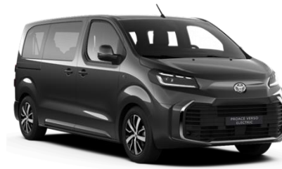
KTV Graphite Black