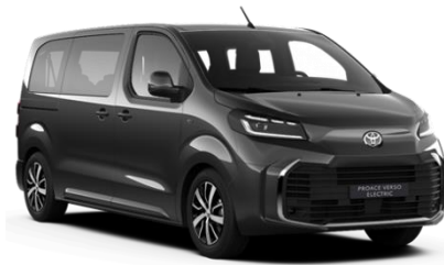
KKJ Titanium Grey