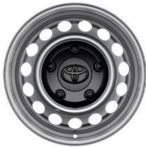
16" Stahlfelgen mit Radnabenabdeckung