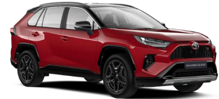
2SU Emotional Red / Black