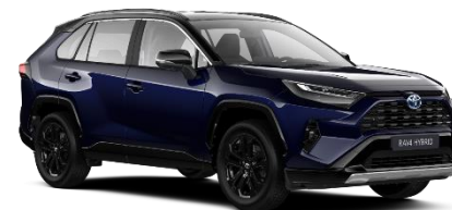
2RA Midnight Blue Metallic / Black