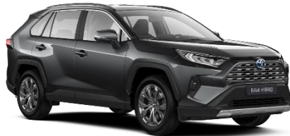
1G3 Ash Grey Metallic