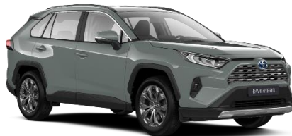
6X3 Urban Khaki