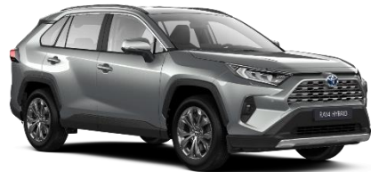
1D6 Zircon Silver Metallic