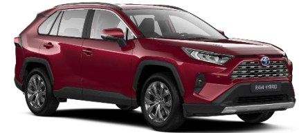
3T3 Tokyo Red Metallic