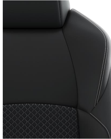
Sitzbezug Stoff mit Textilleder- Applikationen, schwarz mit Ziernähten in Grau