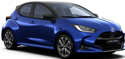
M20 Juniper Blue / Onyx Black