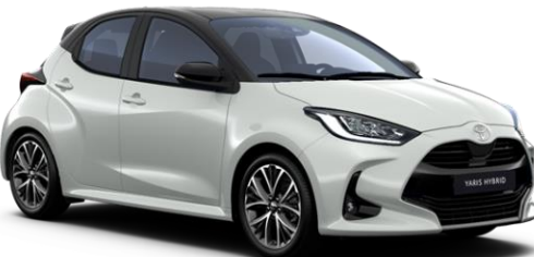
2PU Platinum Pearlwhite / Night Sky Black