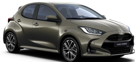
6X1 Oxide Bronze Metallic