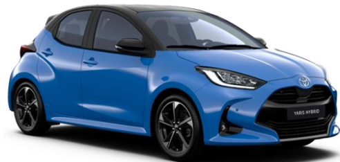
M19 Neptune Blue / Onyx Black