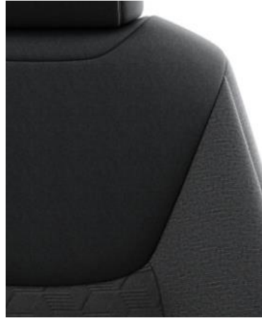
Sitzbezug Stoff, schwarz mit Ziernähten in Melange