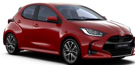
3U5 Emotional Red Metallic