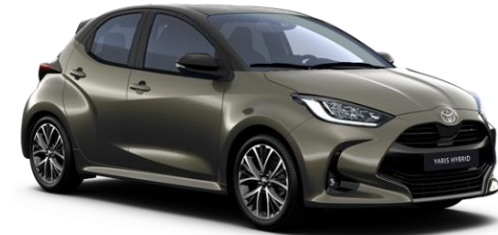
2TK Oxide Bronze / Onyx Black