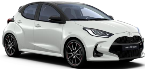
2VF Dynamic Grey / Night Sky Black