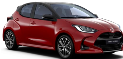
2SZ Emotional Red / Night Sky Black