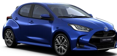
8Y8 Juniper Blue Metallic