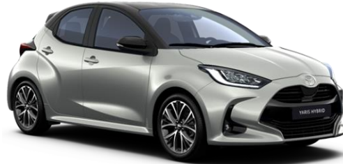
2VU Shimmering Silver / Onyx Black