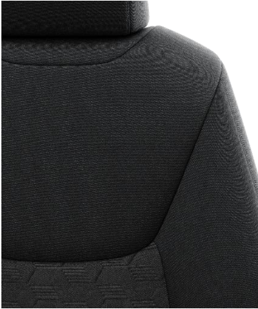
Sitzbezug Stoff, schwarz