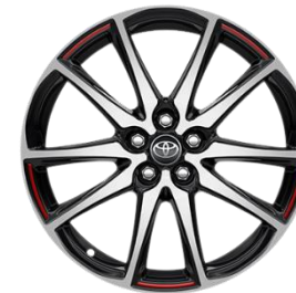
18" Leichtmetallfelge 5 Doppelspeichen schwarz/oberflächenpoliert