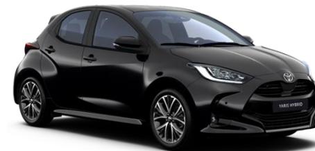
209 Night Sky Black Metallic