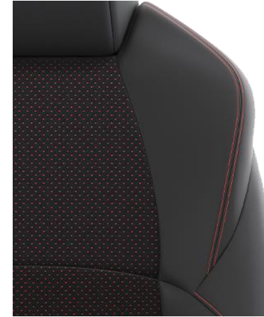
Sitzbezug Ultrasuede™/Textilleder Schwarz mit Ziernähten in Rot