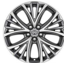
17" Leichtmetallfelge 5 Doppelspeichen schwarz