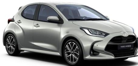
1L0 Shimmering Silver Metallic