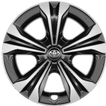
18" Leichtmetallfelgen inkl. Kunststoffabdeckung 5 Speichen schwarz / silber