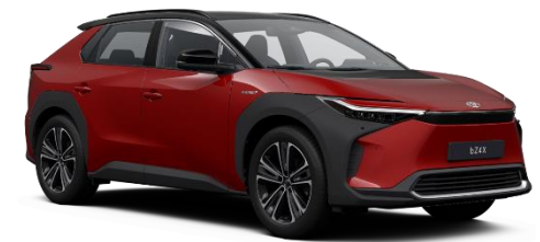
2TB Emotional Red/Black Metallic

Erfahrungsgemäß können Druckfarben den Farbton von Lackierungen nicht originalgetreu wiedergeben