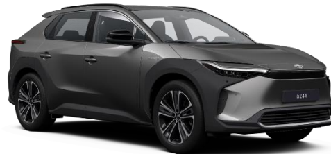
1L5 Precious Metal Metallic