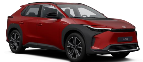
3U5 Emotional Red Metallic