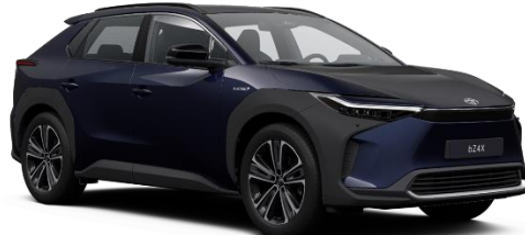
8S6 Pacific Blue Metallic