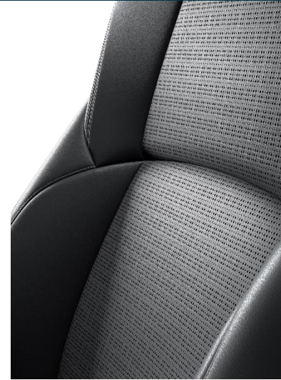
Textilleder, perforiert schwarz | hellgrau