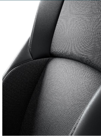
Stoff mit Textilleder-Applikationen schwarz