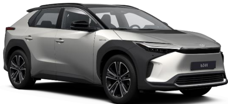
2MR Sonic Silver/Black Metallic