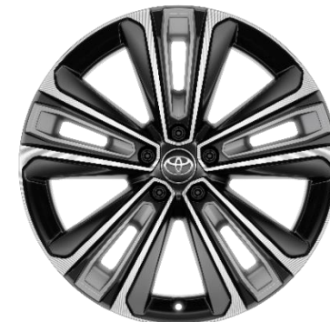
20" Leichtmetallfelgen 5 Doppel-Speichen schwarz / oberflächenpoliert

● = Serie, ○ = Option, P = Teil eines Pakets, - = nicht verfügbar. Die Preise sind unverbindliche Preisempfehlungen des Herstellers ab Werk in Euro exkl. NoVA und MwSt.