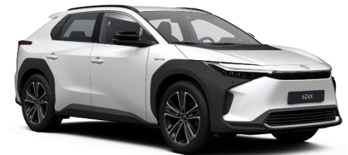
089 Platinum Pearlwhite Metallic