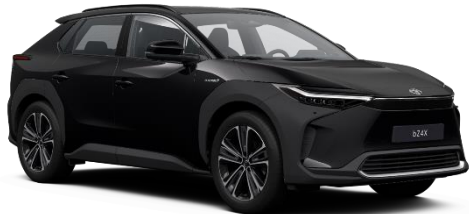
202 Onyx Black