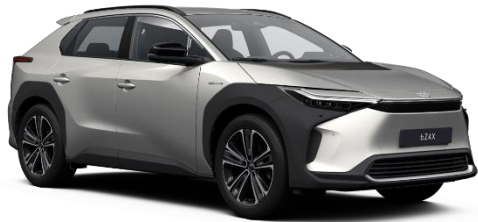
1J6 Sonic Silver Metallic