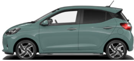
Mangrove Green Pearl Kontrastdach verfügbar