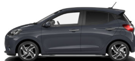
Aurora Gray Pearl