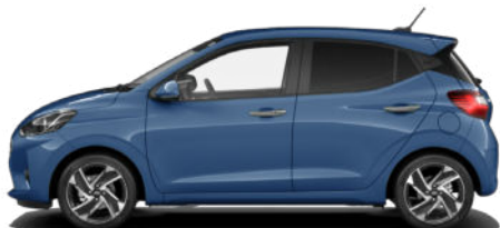
Vibrant Blue Pearl Kontrastdach verfügbar