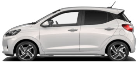
Lumen Gray Pearl Kontrastdach verfügbar