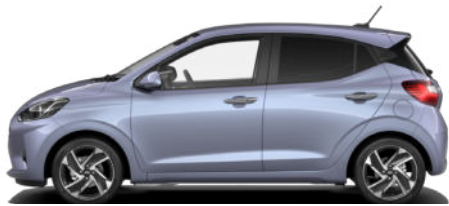
Meta Blue Pearl Kontrastdach verfügbar nicht für N Line