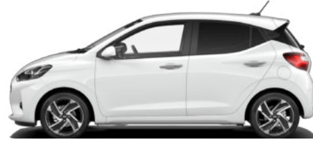
Atlas White Kontrastdach verfügbar