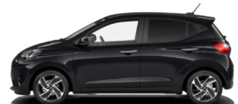
Phantom Black Pearl