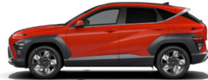
Soultronic Orange Pearl nicht verfügbar für Benzin und N Line