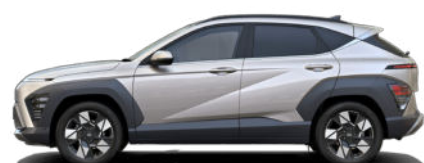
Shimmering Silver Metallic nicht verfügbar für Hybrid