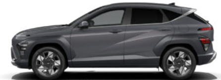
Ecotronic Gray Pearl