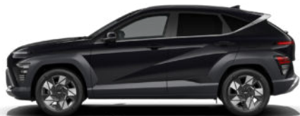
Abyss Black Pearl nicht verfügbar für Hybrid