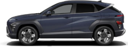
Denim Blue Pearl