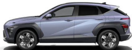
Meta Blue Pearl nicht verfügbar für N Line