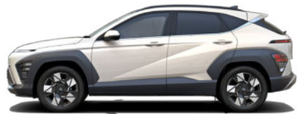
Serenity White Pearl nicht verfügbar für Hybrid