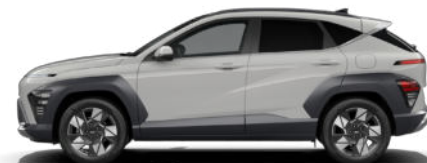
Cyber Gray Metallic