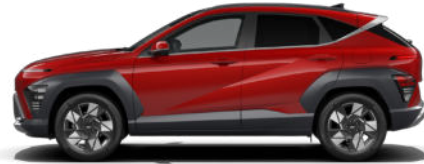
Ultimate Red Metallic