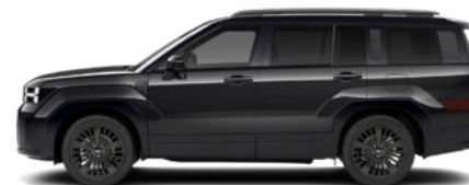
Abyss Black Pearl