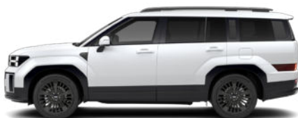
Creamy White Matte