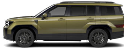
Ocado Green Pearl