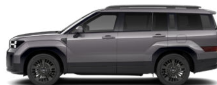
Magnetic Gray Metallic