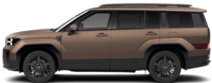
Earthy Brass Matte