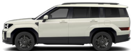
Cyber Sage Pearl