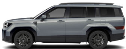
Pebble Blue Pearl