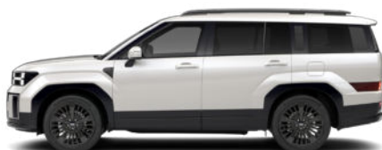
Creamy White Pearl