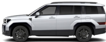
Typhoon Silver Metallic